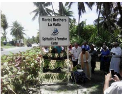
Quiribáti: Abertura do Ano La Valla em Bikenibeu