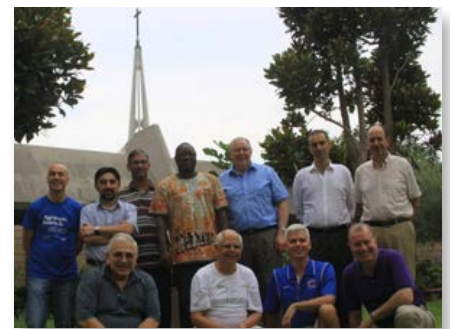
Casa Geral: Quarto encontro da Comissão Preparatória do XXII Capitulo Geral