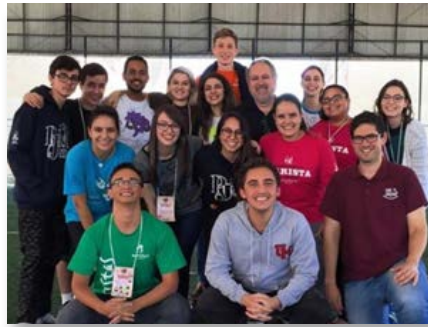
Brasil: Comissões de Juventudes da Província Brasil Centro-Sul