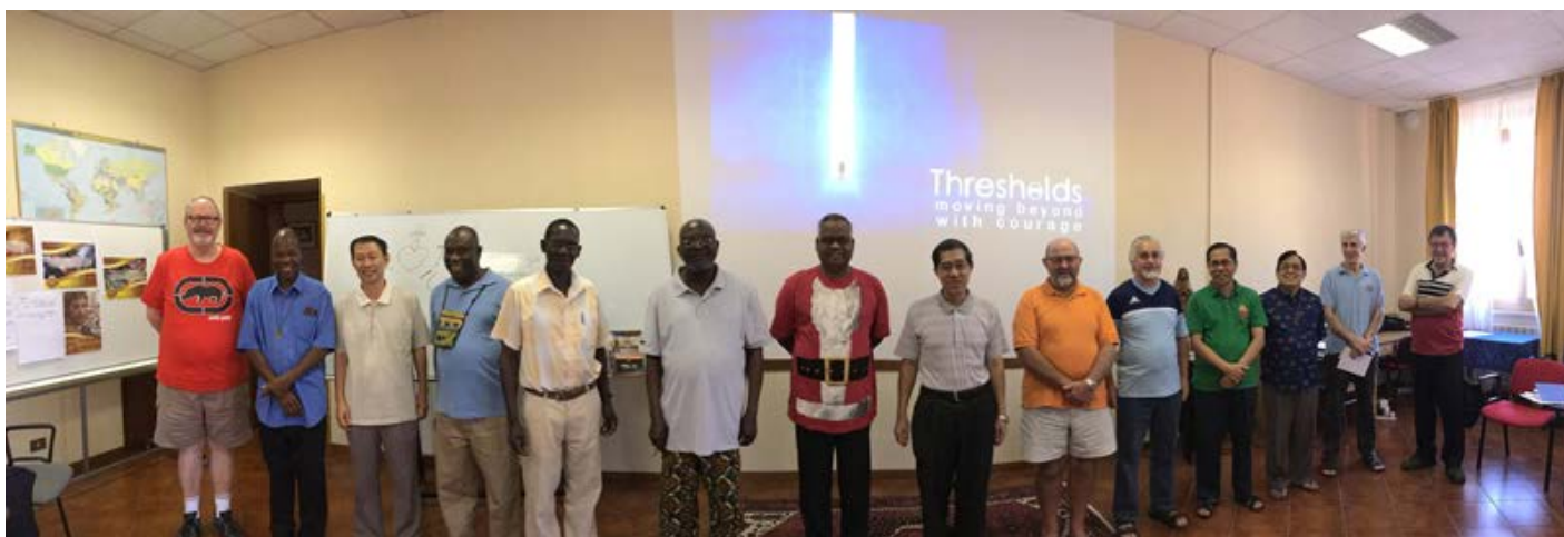
Umbrales - Manziana

Les deux cours incluent un séjour d'une semaine à l'Hermitage, en France, pour visiter les lieux historiques, significatifs pour l'Institut.