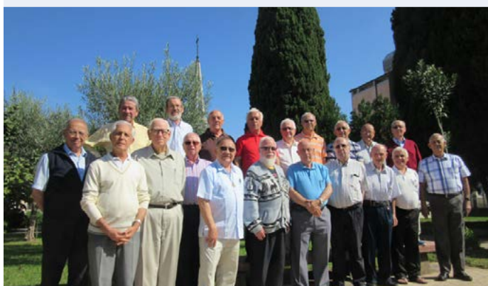
Troisième âge - Maison Générale