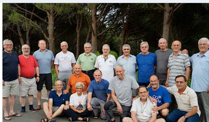
Umbrales - El Escorial