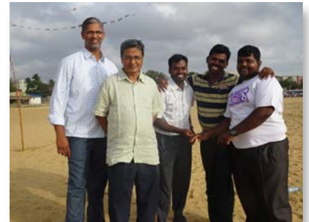
Sri Lanka: Negombo