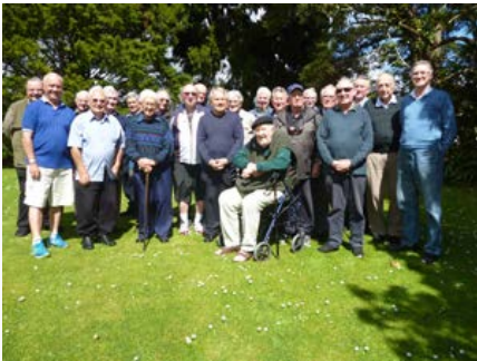
Nouvelle-Zélande: Retraite à Auckland