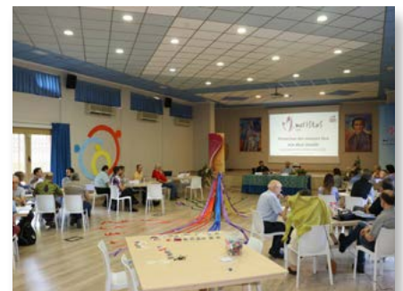
Espagne: Réunion des 4 provinces sur la protection des mineurs - Guardamar