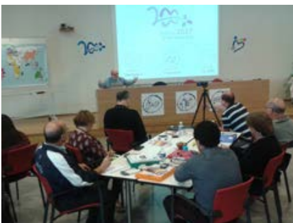
France: Le Supérieur Général à la Rencontre des commissions continentales du laïcat