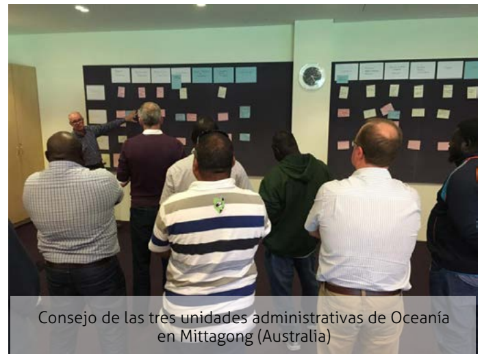
Consejo de las tres unidades administrativas de Oceanía en Mittagong (Australia)

Se estudiaron y priorizaron once iniciativas. Se acordó un cronograma para su desarrollo y una estrategia de aplicación. Se formalizarán las iniciativas y se creará un equipo de im-