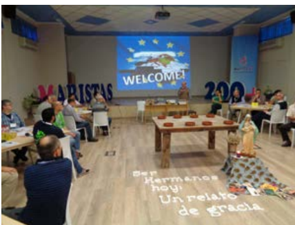
Espanha: abertura do Conselho geral ampliado da Europa, Guardamar