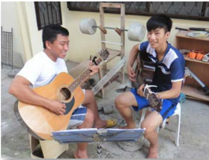
Filipinas: Postulantado em Davao