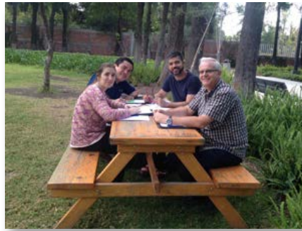
México: Subcomissão de evangelização da América - Irapuato Guanajuato