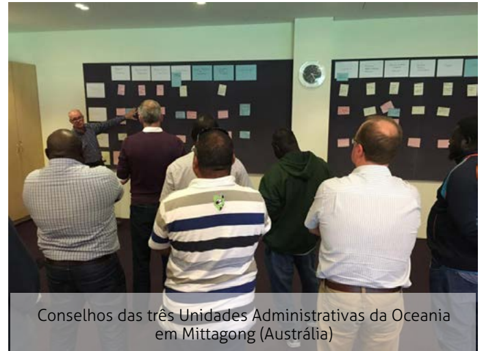
Conselhos das três Unidades Administrativas da Oceania em Mittagong (Austrália)

As iniciativas serão formalizadas no próximo encontro do Conselho da Oceania, de 6 a 8 de novembro.