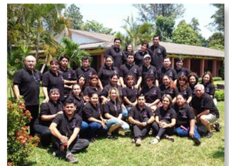
Bolívia: Programa de formação de animadores maristas

do Brasil (UMBRASIL), reuniu mais de 2 mil educadores e gestores, entidades vinculadas à educação e convidados nacionais e internacionais para discutir a promoção do direito a uma educação integral de qualidade.