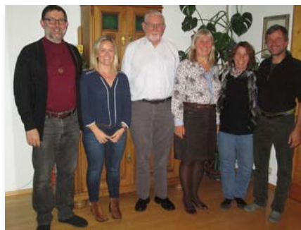
Alemanha: Encontro da Cmi da Prov. Europa Centro-Oeste, em Mindelheim