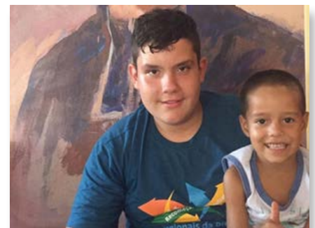
Brasil Bacabeira, Maranhão