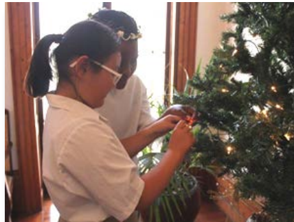
África do Sul: St Joseph's Marist College e as decorações de Natal