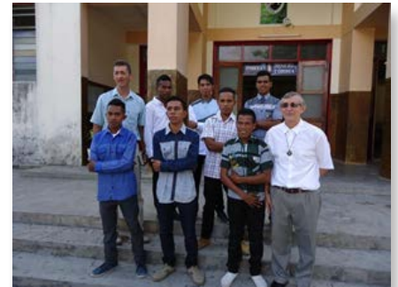
Timor Leste: encontro vocacional Marista em Baucau