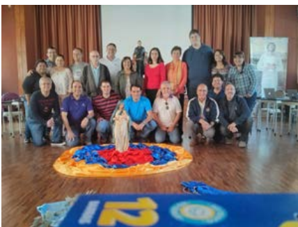
Equador: Encontro de coordenadores das comissões de leigos das Américas