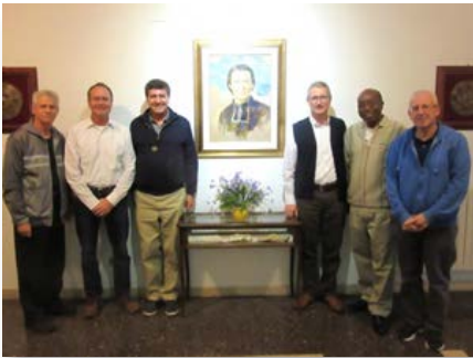
Casa Geral: Comissão de revisão das Constituições