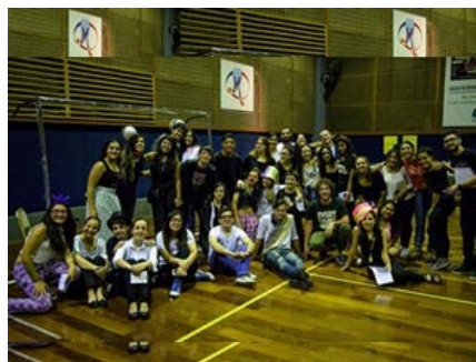
Argentina Colégio Macnab Bernal