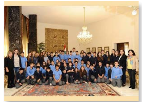
Líbano Collège Mariste Champville