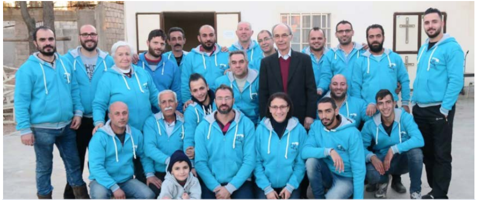
Equipo de voluntarios que trabajan en la distribución de canastas de alimentos