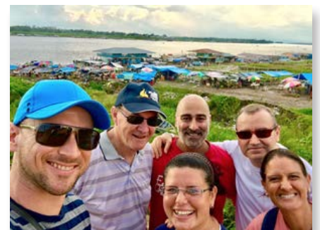
Brasil - LaValla200> Comunidad de Tabatinga