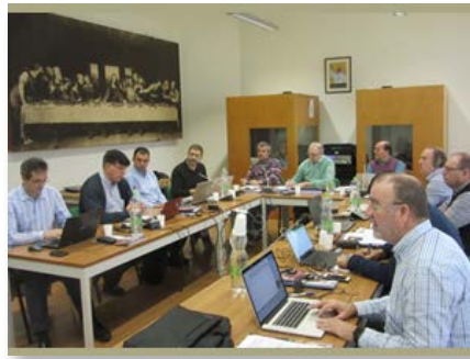
Maison Générale - Rencontre des Économistes provinciaux d'Europe