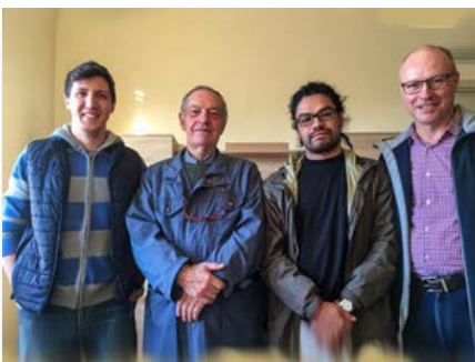
Italie - LaValla200> Communauté de Siracusa, Sicilia