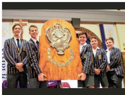
Afrique du Sud: St David's Marist Inanda