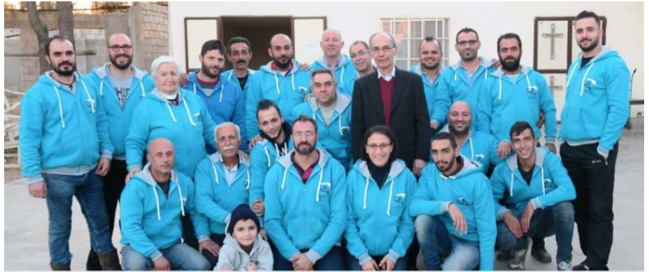
L'équipe de bénévoles qui travaillent dans la distribution des paniers