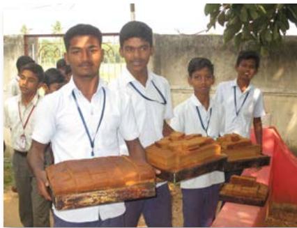
Inde: St. Marcellin Higher secondary School Mangamanuthu