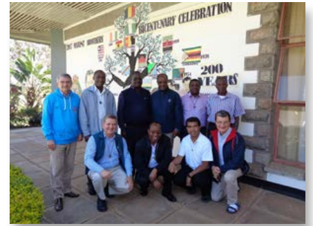
Kenya: Assemblée générale Annuelle des Provinciaux Maristes de l'Afrique - Nairobi