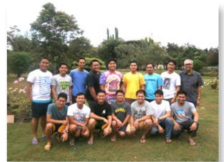
Philippines: Rencontre des frères jeunes

de la paroisse Saint-Ennemond en Gier, d'amis des frères, a participé avec ferveur à cette messe d'action de grâce, présidée par Mgr Sylvain Bataille, nouvel évêque de Saint-Étienne. Divers objets symboliques ainsi qu'une très belle décoration florale ont donné un caractère festif et très évocateur de la réalité mariste à cette messe.