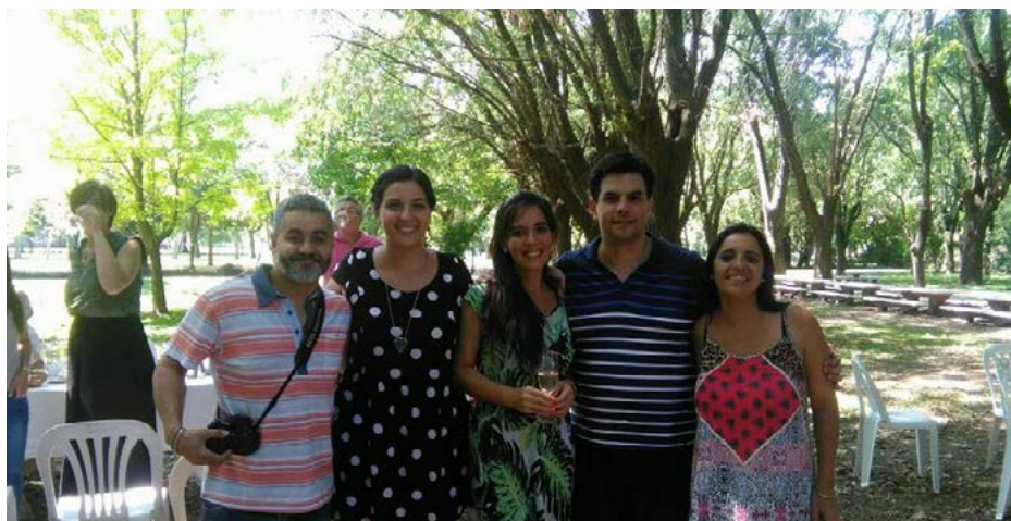
Aller déjeuner à l'endroit où les premiers Petits Frères vivaient, à la Villa Marista.