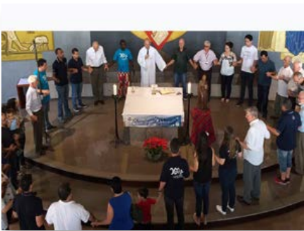
Brésil: Bicentenaire de la fondation de l'Institut à Curitiba