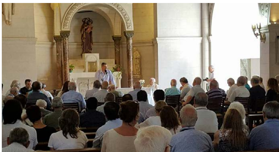
La nouvelle chapelle dans la Villa Marista

Ils se sont ensuite rendus à la Basilique de Luján pour une célébration eucharistique, en compagnie de l'évêque, du nonce apostolique et de nombreux confrères prêtres qui accompagnent la mission des Petits Frères de Marie depuis plusieurs années. Ont également participé à la messe avec les frères, les direc-