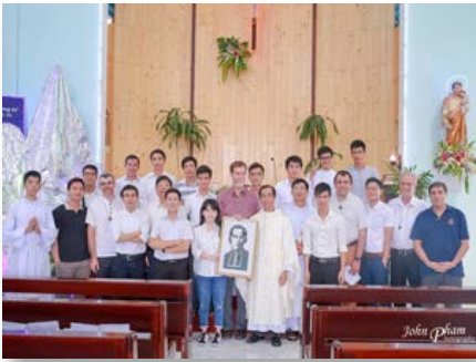
Viêt Nam: Saigon