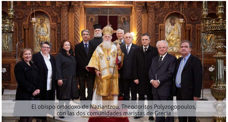
El obispo ortodoxo de Naziantzou, Theodoritos Polyzogopoulos, con las dos comunidades maristas de Grecia

Veintitrés nuevos maestros de las escuelas maristas de Nueva Zelanda se reunieron el día 8 de febrero para seguir un seminario sobre vida cristiana y carisma marista.