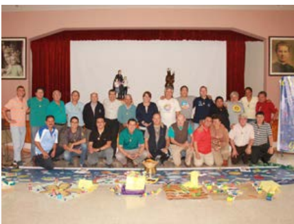
Ecuador: Consejo provincial junto con las seis comisiones provinciales en Quito