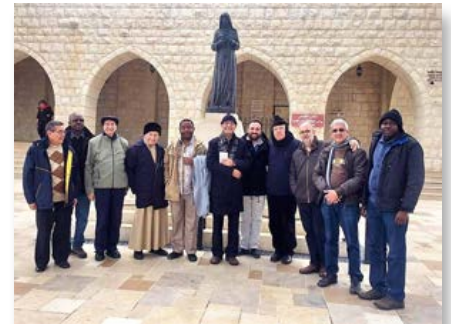
Líbano: Hermanos de las dos comunidades del Líbano con algunos amigos