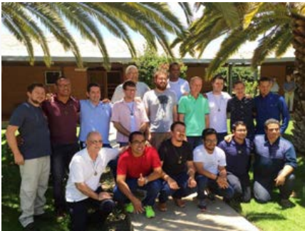
Bolivia: Hermanos de cinco países se preparan para la profesión perpetua