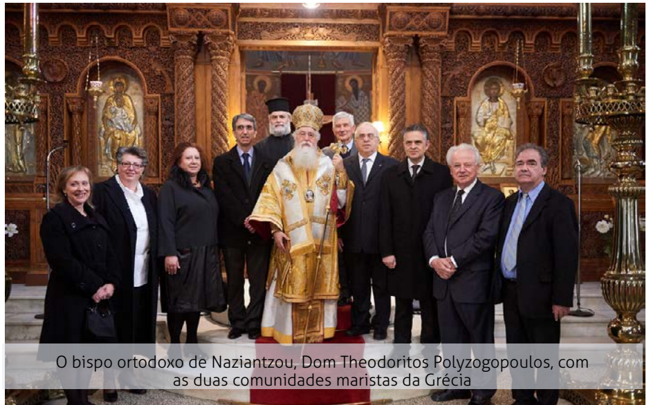
O bispo ortodoxo de Naziantzou, Dom Theodoritos Polyzogopoulos, com as duas comunidades maristas da Grécia

23 novos professores das escolas maristas da Nova Zelândia se encontraram no dia 8 de fevereiro para um seminário, onde foram tratados diversos temas relativos à vida cristã e ao carisma marista.