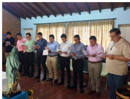
Colômbia: Entrada de novos noviços no Noviciado Interprovincial de Medellín