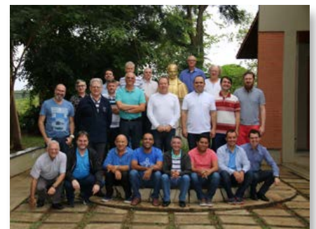
Brasil: 13ª Assembleia Geral ordinária da UMBRASIL