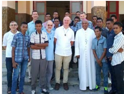
Timor Leste: Pastoral vocacional em Baucau