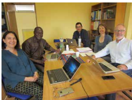
Maison Générale: l'équipe chargée d'élaborer le programme de formation Nouveaux Horizons