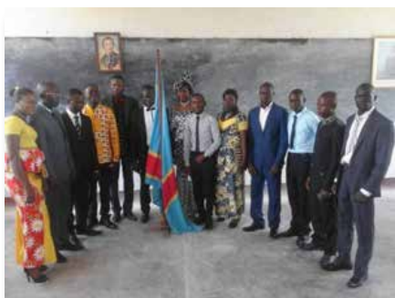
Rép. Dém. du Congo: Université Mariste du Congo