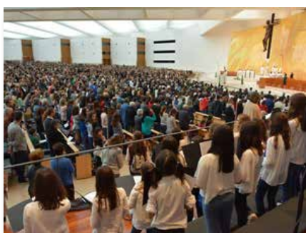
Portugal: Pèlerinage mariste à Fátima