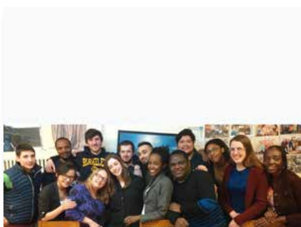
Canada: Communauté d'accueil de Willowdale