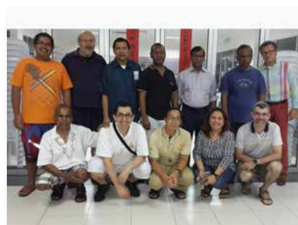
Malaisie: Réunion de la Conférence Mariste d'Asie à Kuala Lumpur