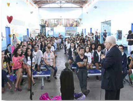
Brésil: Célébration du Bicentenaire à Terra Vermelha