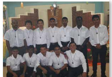
Sri Lanka: Marist International Tudella Novitiate