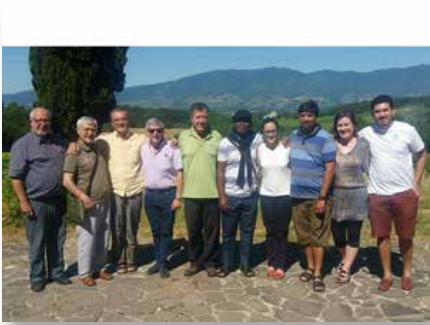
Italy: Camaldoli: Formation of the candidates according to the Program Lavalla200>