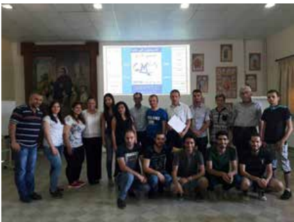
Syrie: Maristes Bleus - Centre de formation des adultes, « M.I.T. »