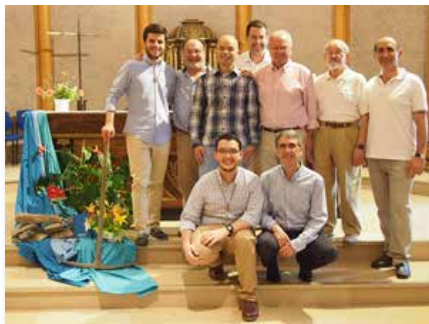
France: Premier profession du F. Than Hua, Hermitage