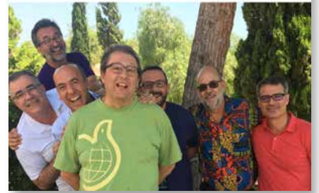
Espagne: Conseil de la Province Méditerranéenne