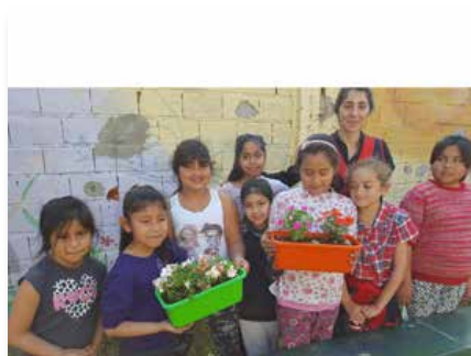
Argentina: Centro Marista Hno Isla, La Plata