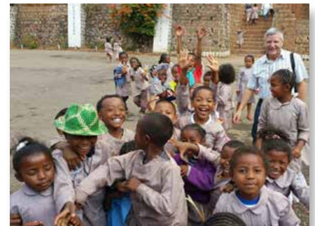
Costa de Marfil: Escuela San Marcelino Champagnat, Bouaké

existir manteniendo al presidente, ampliamente apoyado por la población, el ejército sirio y Rusia. Por lo tanto, las diversas declaraciones de los líderes del mundo occidental indican que su prioridad es luchar contra Daech y el terrorismo - que el gobierno sirio ha estado repitiendo durante seis años - no la caída del régimen.