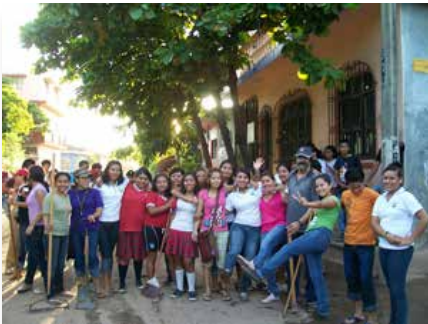
México: Maristas del Bachillerato "Asunción Ixtaltepec", Ixtaltepec