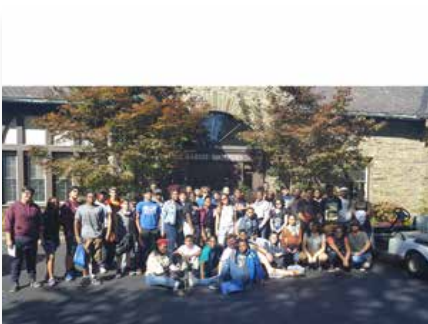
Estados Unidos: 'Día de la Comunidad' anual - Marist High School, Bayonne (NJ)