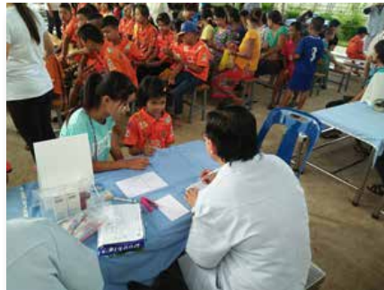
Tailandia: Bangkok ofrece servicios médicos en el centro de migrantes, Samut Sakhon