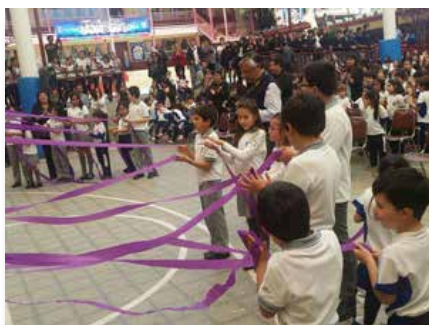
Chili: Colegio Champagnat - Colegio Marista, Villa Alemana