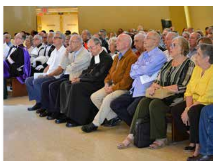
États-Unis: Des Maristes de Cuba célèbrent le bicentenaire, Miami