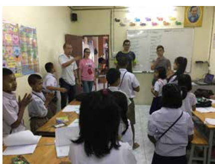
Thaïlande: Centre Mariste pour les Migrants, Samut Sakhon