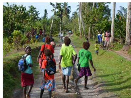
Papouasie-Nouvelle-Guinée: St Joseph's College, Mabiri - l'île de Bougainville