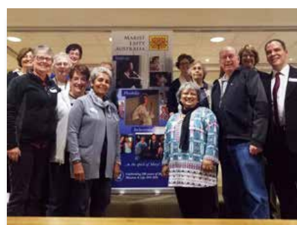
Australie: Journée de réflexion des laïcs maristes - Sydney