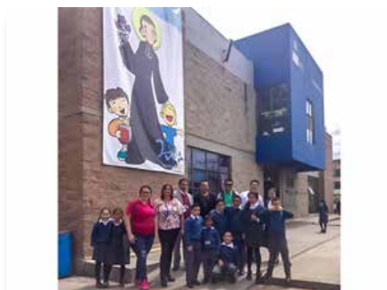
Colombie: Présentation de la vocation mariste dans deux écoles, Bogotá