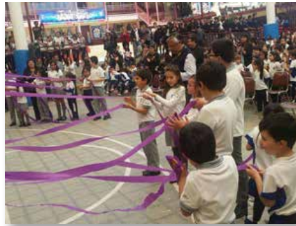
Chile: Colegio Champagnat - Colegio Marista, Villa Alemana