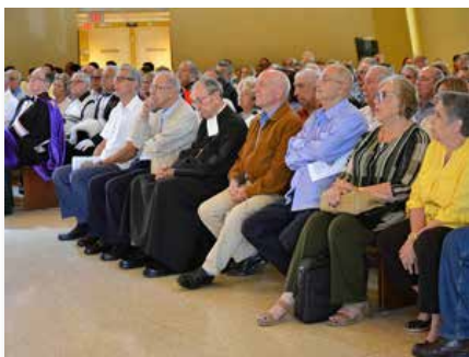
Estados Unidos: Maristas de Cuba celebram o bicentenário, Miami