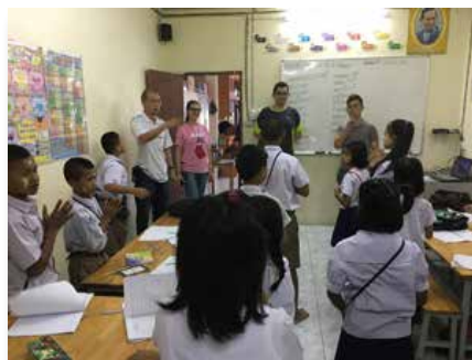
Tailândia: Centro Marista para Migrantes, Samut Sakhon