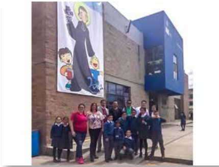
Colômbia: Apresentando vocação marista em duas escolas, Bogotá