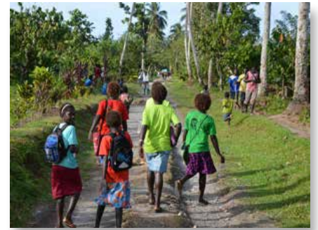
Papua-Nova Guiné: St Joseph's College, Mabiri - Ilha de Bougainville