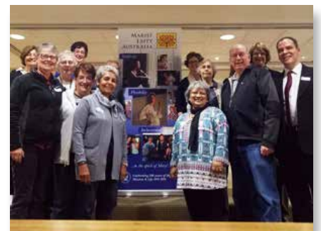
Austrália: Dia de Reflexão de Leigos Maristas, Sydney