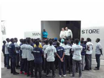
Tanzanie: Marist Boys Secondary School visite la société de boissons Sayona, Mwanza