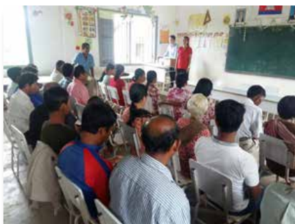
Cambodia: Talleres de salud, Pailin