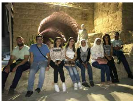
Liban: Les maristes bleus d'Alep visitent Rmeileh