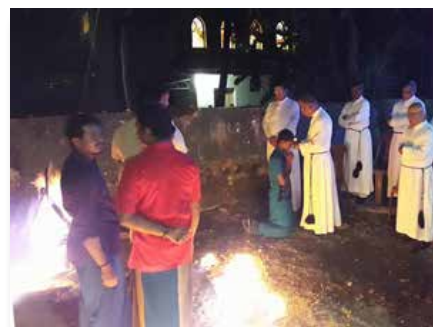
Sri Lanka: Pastorale Mariste des Jeunes, Negombo