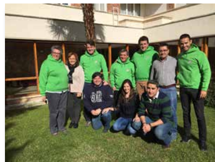
Espagne: Cours pour la mission des leaders maristes en Europe, Alcalá de Henares

publiées, mais par les dimensions de la spiritualité, de la communauté et de la mission maristes présentées dans la réalité au jour le jour, comme en fait foi la première image qui ouvre l'œuvre : anonymes, en route, sans galons ni uniforme, sans bagage, mais ensemble dans les rues d'un quartier.