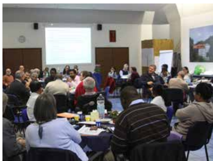
Maison Générale: Séminaire sur la méthode de «reconnaissance appréciative» (SEDOS)