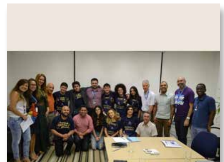
Brasil: Comisión Provincial de Juventud, Brasil Centro-Norte - Brasilia