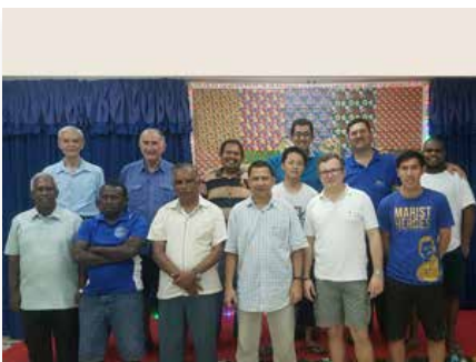
Filipinas: Marist Asia Pacific Center (MAPAC), Marikina City