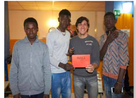
Italia: Comunidades Internacionales para un Nuevo Comienzo Lavalla200>, Siracusa