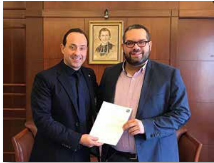
Liban: Accord de bourses d'études entre l'école de Champville et l'USEK, Dik El Mehdi