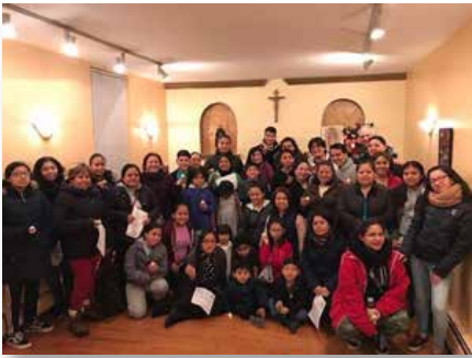
États-Unis: Communauté d'East Harlem (Lavalla 200>), New York