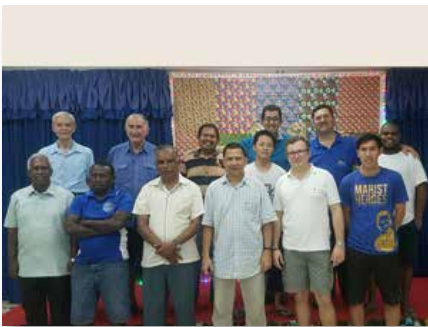
Filipinas: Marist Asia Pacific Center (MAPAC), Marikina City