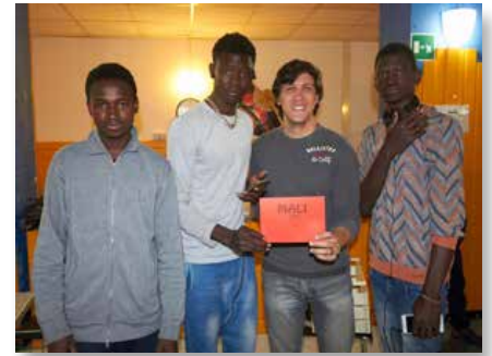
Itália: Comunidades Internacionais para um Novo Começo Lavalla200>, Siracusa