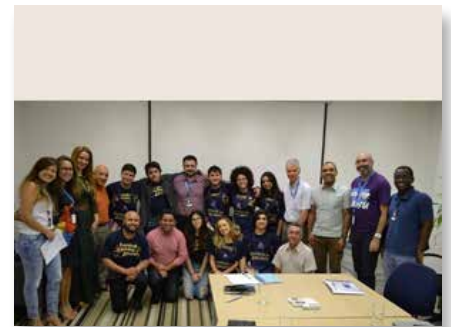
Brasil: Comissão Provincial da Juventude, Brasil Centro-Norte - Brasília

apresentou-se o relatório dos trabalhos da Comissão preparatória e foi lido o regulamento do Capítulo. T