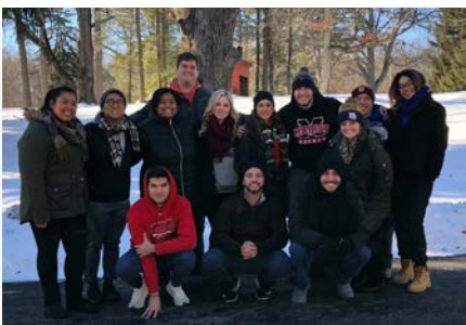
États-Unis: Comité consultatif des jeunes adultes