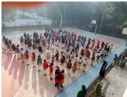
Bangladesh: St. Marcellin School, Giasnigor