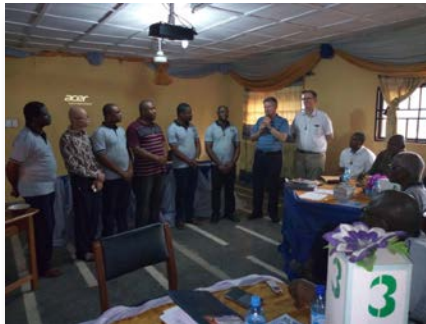
Nigeria Chapitre provincial, Orlu