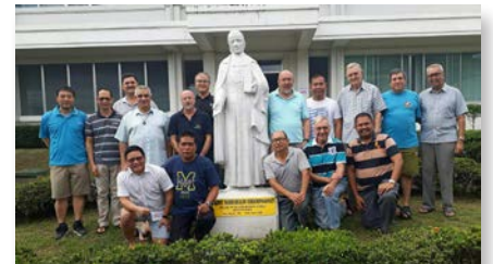
Philippines: Formateurs maristes de la région d'Asie réunis à MAPAC