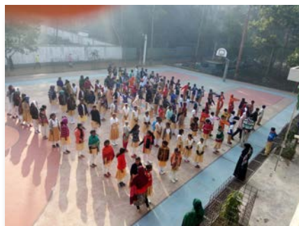
Bangladeche: St. Marcellin School, Giasnogor