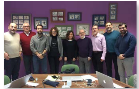
Espanha: Rede de equipes de comunicação dos maristas na Espanha