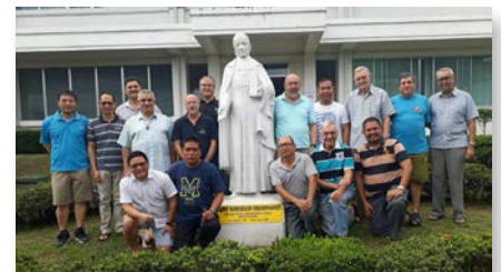
Filipinas: Formadores da Região Asia reunidos no MAPAC