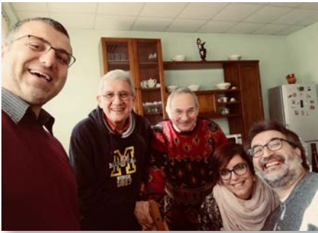
Italia: Comunidad de Giugliano