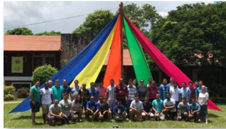
Paraguay: Rencontre de jeunes frères d'Amérique Sur, Coronel Oviedo