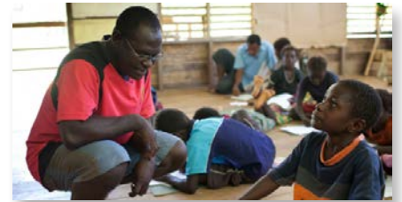
Papouasie-Nouvelle-Guinée: St Joseph's College, Mabiri