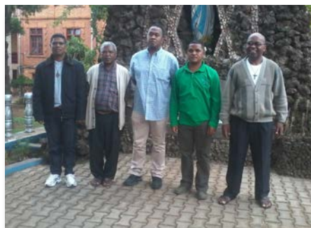
Madagascar: Novo superior e conselheiros provinciais