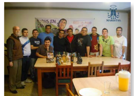
Colômbia: Noviciado marista La Valla, Medellín