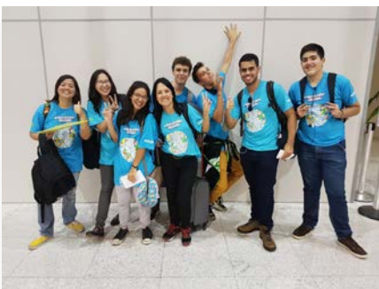
Brasil: Estudantes do Colégio Marista João Paulo II embarcam para intercâmbio na Oceania