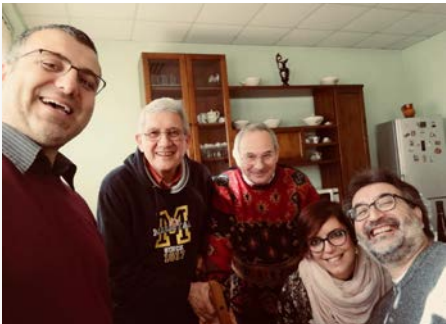
Itália: Comunidade de Giugliano