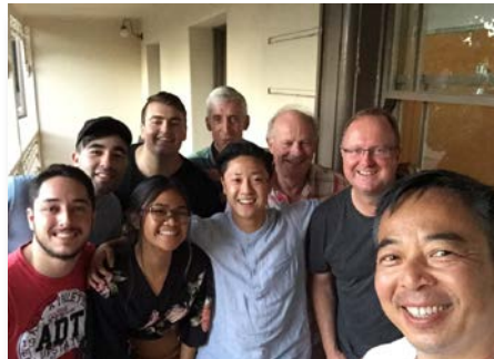
Australia: Líderes de la Pastoral Juvenil Marista en Melbourne