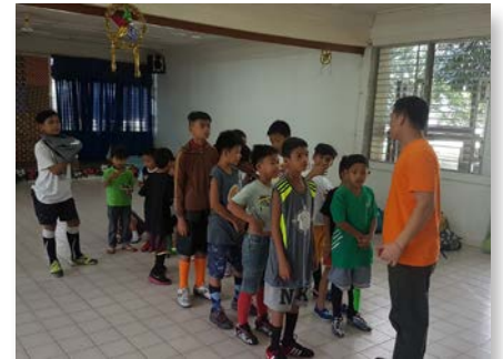
Filipinas: MAPAC, Marikina City