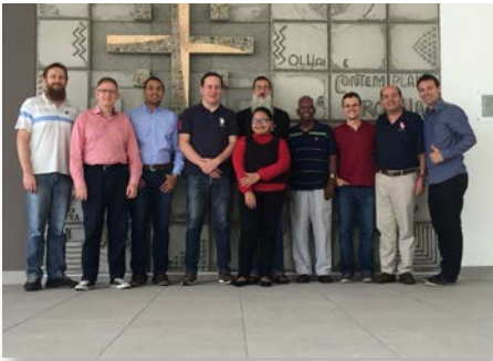
Brasil: Encontro da equipe técnica de sustentabilidade da África e da Ásia, Curitiba