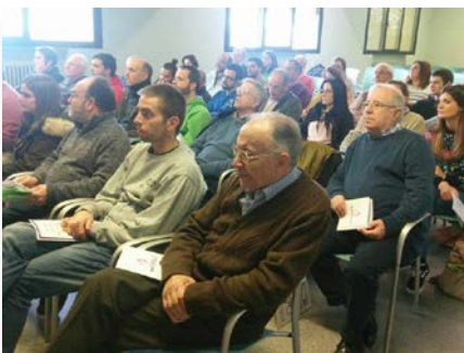
Espanha: Reunião em Ibérica sobre a vida dos jovens no mundo de hoje, Lardero