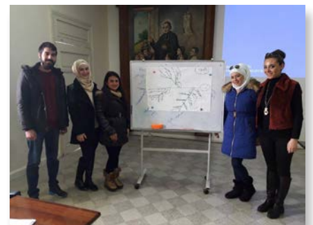
Síria: Workshop dos Maristas Azuis sobre as habilidades de vida, Aleppo