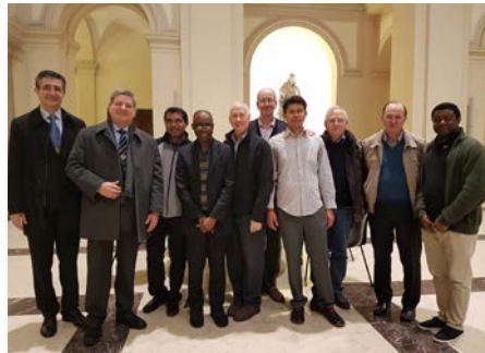
Italie Gregorian University