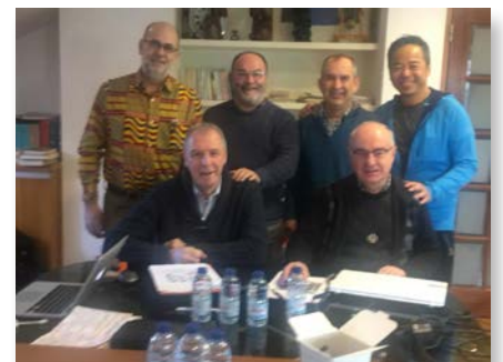
Portugal: Réunion de la Commission des Frères Aujourd'hui d'Europe, Lisbonne