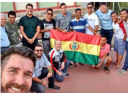
Bolivie Novitiate à Cochabamba