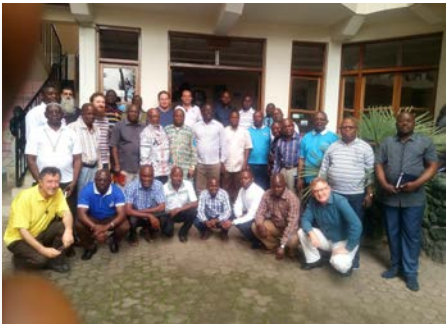
Rwanda: Projet de durabilité pour l'Afrique et l'Asie, II Workshop, à Gisenyi