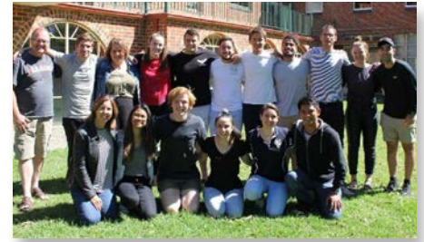
Australia: Equipe nacional de Pastoral de la Juventud Marista