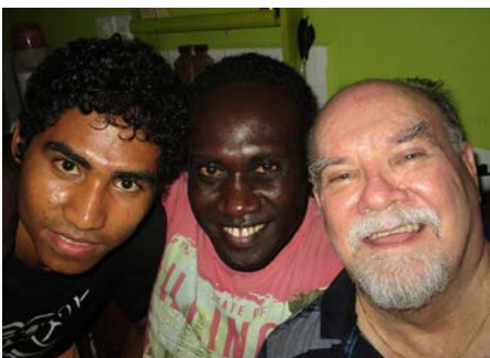
Sri Lanka Noviciado de Tudella