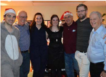
Canadá Maison Mariste de Sherbrooke