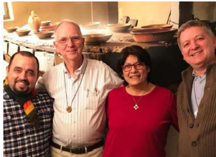
Estados Unidos: o Superior Geral visita a comunidade Lavalla200> de Harlem