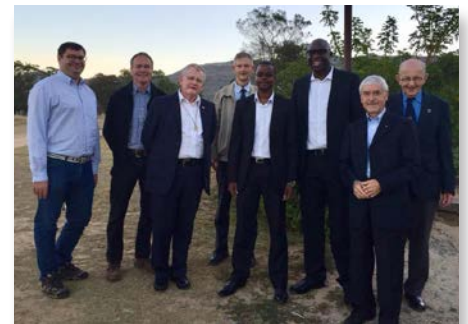
África do Sul: centenário do St Joseph's Marist College, Rondebosch, Cape Town