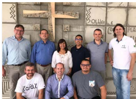
Brasil: reunião da Equipe Vocacional da América Sul, em Curitiba