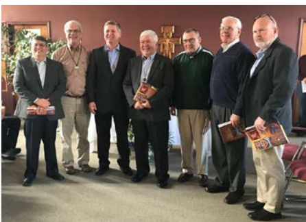
Estados Unidos: novo Conselho da Província United States