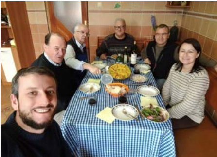
Romênia: os formadores visitam a comunidade Lavalla200> de Moinesti