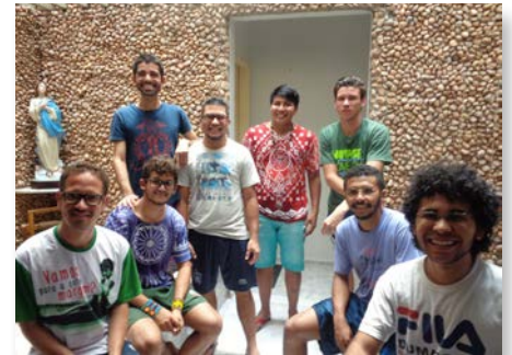
Postulantes das Províncias Brasil Centro-Norte e Brasil Sul-Amazônia, Maraponga – Fortaleza