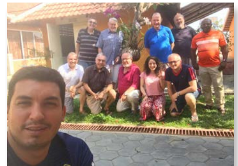
Camboya: Directores de Cmi y los formadores visitan miembros de Lavalla200>, Phnom Penh