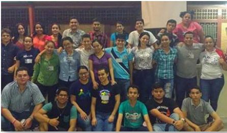
Nicaragua Pasqua con Remar, Estelí