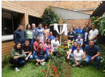
Colombia: Pasqua en Medellín con hermanos y laicos/as