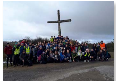
España: Camino de Santiago, Provincia Compostela