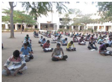
India St. Marcellin School, Mangamanuthu