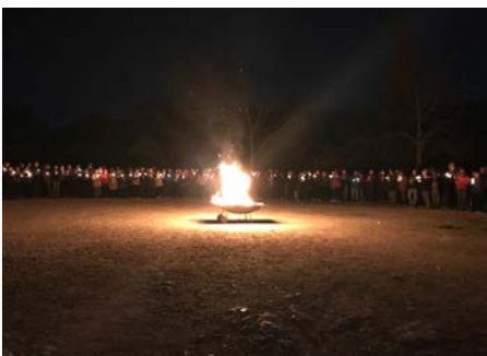
España Pasqua de les Avellanes