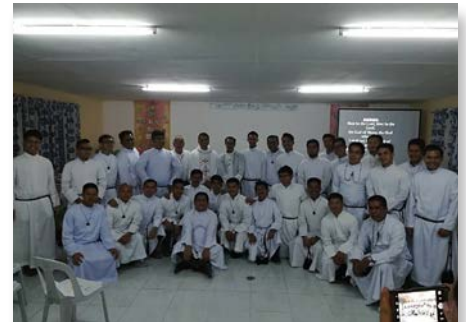
Philippines Mindanao : renouvellement des vœux