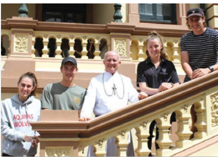
Australie Aquinas College, Adelaide