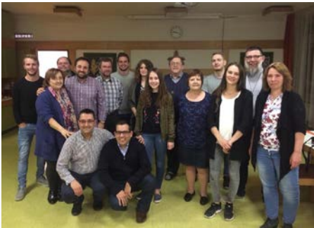
Allemagne : Pastorale Juvénile et vocationnelle de l'Europe visite la communauté de Mindelheim