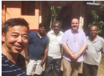
Sri Lanka : 'Marist Sevana' Maison de spiritualité mariste