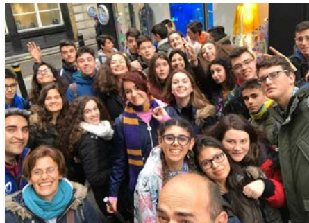
Royaume-Uni : Des étudiants de Guadalajara, en Espagne, visitent Londres