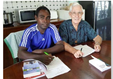
Papouasie-Nouvelle-Guinée Port Moresby