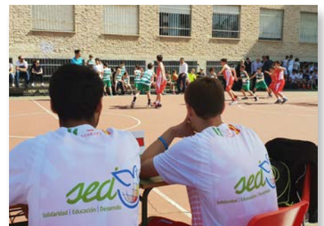
Espagne: Maristiada 2018 à l'école Cervantes - Córdoba