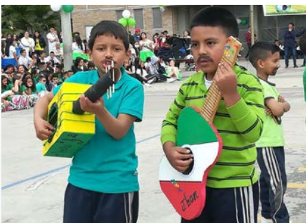
Colombie Colegio La Esperanza, Bogotá