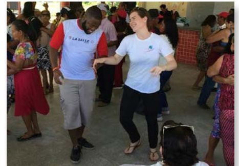
Brésil Tabatinga: Lavalla200>