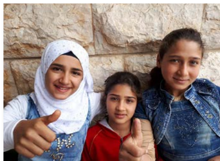
Liban Fratelli Project, Rmeileh