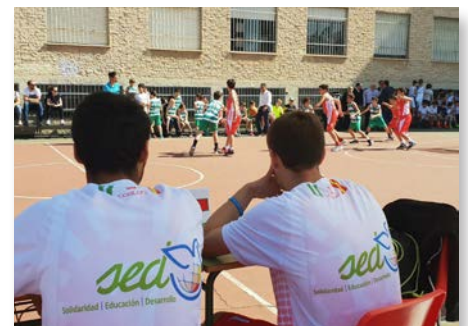
Espanha: Maristiada 2018 na Escola Cervantes - Córdoba