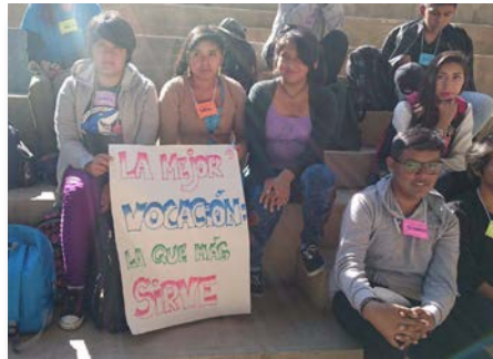
Bolívia: 160 jovens encontram a equipe vocacional marista e o noviciado de Cochabamba