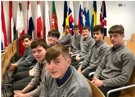
Irlanda Estudiantes líderes maristas en Dublin