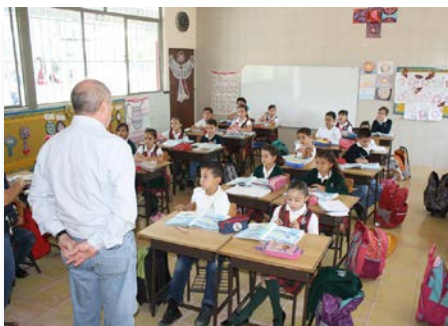
México: Visita del Provincial al Colegio Marista Primaria de Aguascalientes