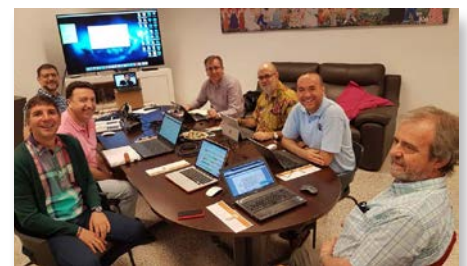
España: Junta de Delegados de las provincias con obras en España