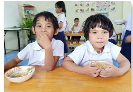
Tailandia: Centro marista para migrantes, Samut Sakhon