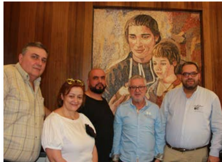
Líbano: Champville - Novo mosaico de Marcelino Champagnat