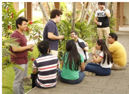
El Salvador Curso de Animadores