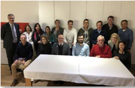
Australie Marist Centre Sydney