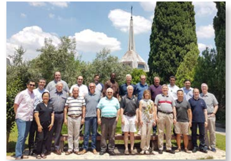
Maison Générale. Réunion du conseil général avec les secrétariats - Rome