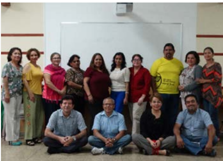
El Salvador: Frères et laïcs du Groupe de Fourvière - San Salvador