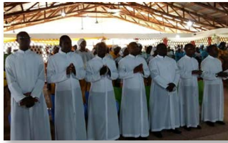
Ghana: Premières professions au noviciat de Kumasi