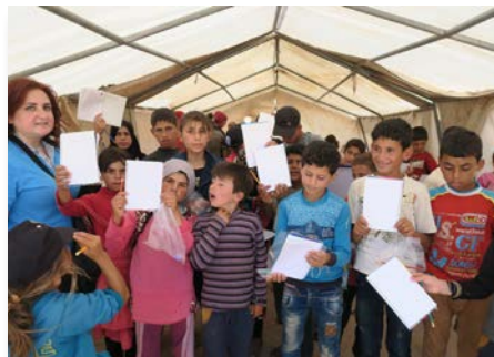
Syrie: Les maristes bleus aident les réfugiés près de Tell Rifaat