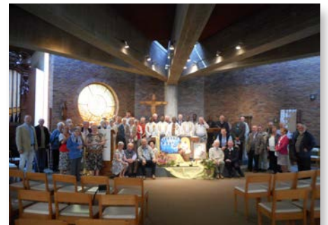
Belgique: Genva - Communauté des frères aînés célèbre la fête de Saint Marcellin