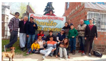
Argentina: Encuentro del voluntariado en el barrio San Jorge de Lujan