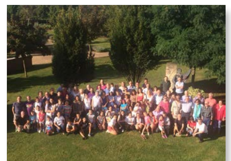
España: Encuentro de las fraternidades de la Provincia Ibérica en Lardero