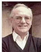
Mgr Pierre Claverie