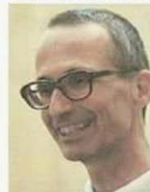
frère Christian de Chergé