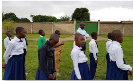
Côte d'Ivoire École Saint Marcellin Champagnat - Bouaké