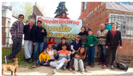
Argentine Réunion de volontaires à Luján