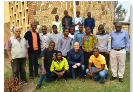
Malawi Postulantes e formadores em Mtendere