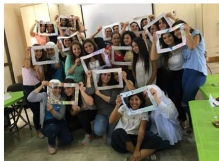
Siria: Seminario sobre resiliencia para los maristas azules