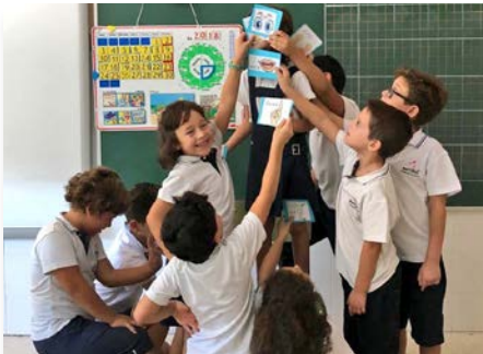
España: Colegio Ntra Sra de Guadalupe Navalmodal de la Mata