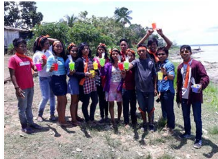
Brasil Umariacú - Lavalla200> Tabatinga