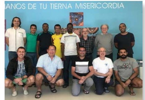
España El Escorial - Horizontes 2018