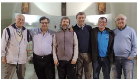
Uruguay Nuevo Consejo Provincial de Cruz del Sur