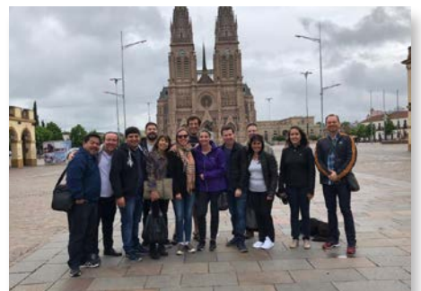
Argentina: Encuentro de la equipe de red de escuelas maristas de América Sur, en Luján