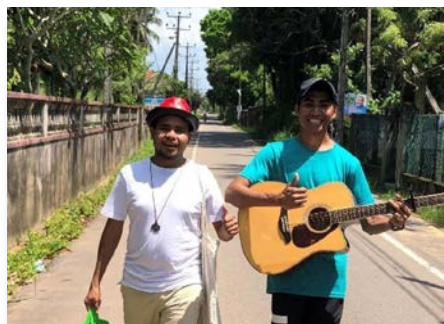
Sri Lanka Novicios del noviciado de Tudella