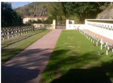
France Cimetière de Notre Dame de l'Hermitage