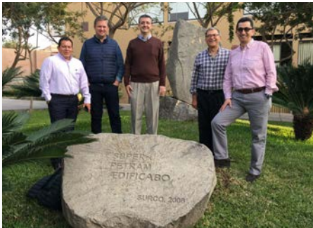
Pérou: Commission Exécutive du Réseau Mariste International des Institutions de l'Éducation Supérieure