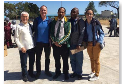
África do Sul: Comunidade LaValla200> de Atlantis com o diretor de uma escola local