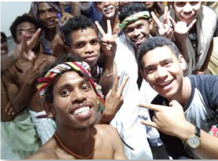
Timor Oriental Rencontre vocationnelle mariste