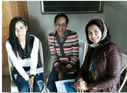
Nicaragua Rencontre des Fraternités maristes