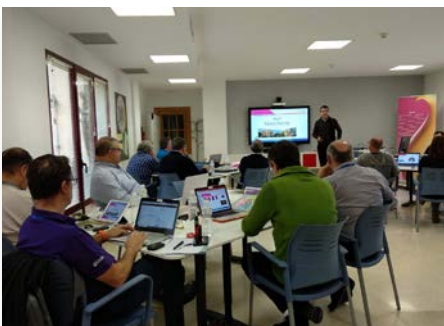
Espagne: Assemblée des représentants de CME à Xaudaró