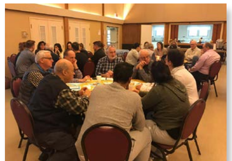
Canada Forum Mariste