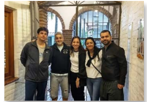
Uruguai: Equipe de comunicação e difusão da Província Cruz del Sur