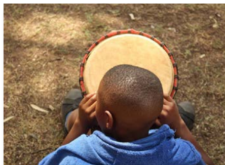
África do Sul Projeto Three2Six