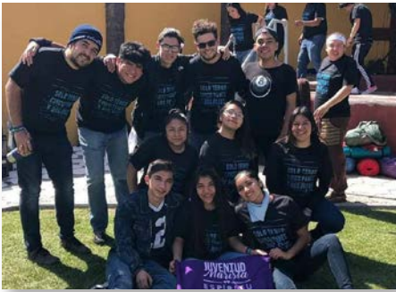
México Bachillerato Basilio Rueda