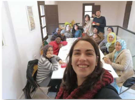
Espanha Granada: Projeto Marista Terra de Todos