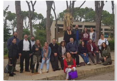
Líbano Catequistas de Champville e Jbail