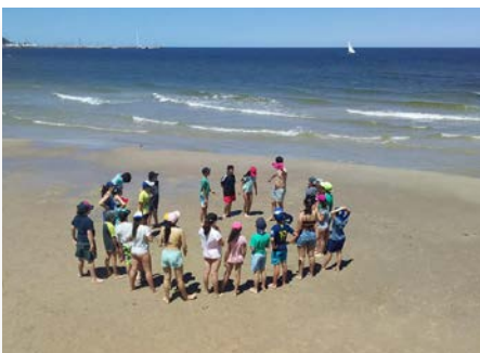
Uruguai Maristas San Luis, Pando