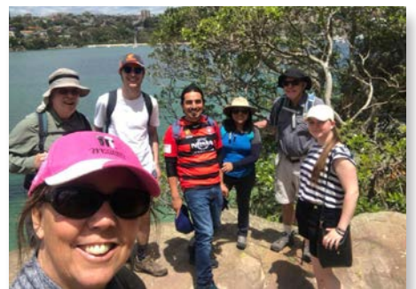
Austrália Pastoral Juvenil Marista de Sydney