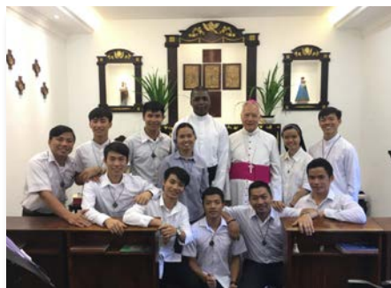
Sri Lanka Marist International Novitiate