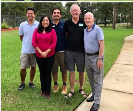
Australie Lavalla200> Mount Druitt