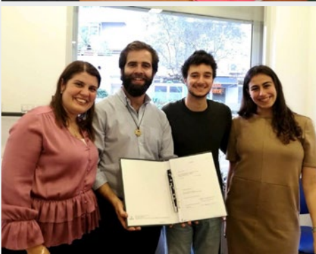
Portugal: Inauguration de la "MarCha Portugal Associação Juvenil"