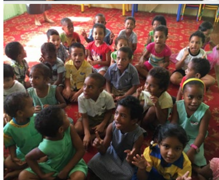
Iles Fidji Marist Kindergarten à Suva