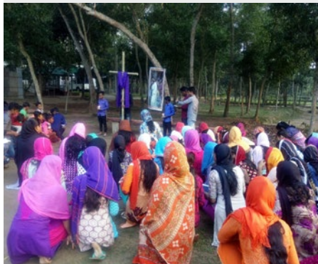
Bangladesh Chemin de croix à Giasnagar - École St Marcellin