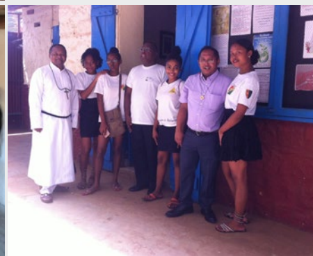
Madagascar: Célébration de la fête de St Joseph à l'Institution St Joseph Antsirana