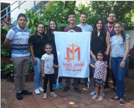
Paraguay: Réunion de référents locaux - Monde de la Jeunesse Mariste - Asunción