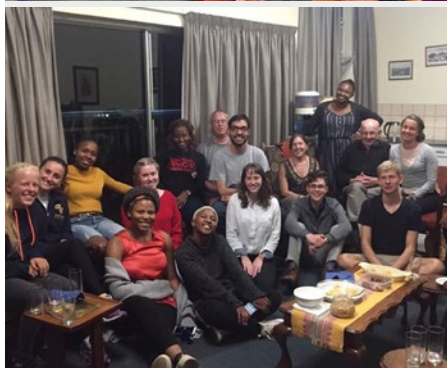
África do Sul Jantar da Juventude Marista - Joanesburgo