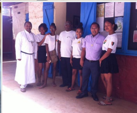
Madagascar: Celebração do Dia de São José na Instituição St Joseph Antsirana