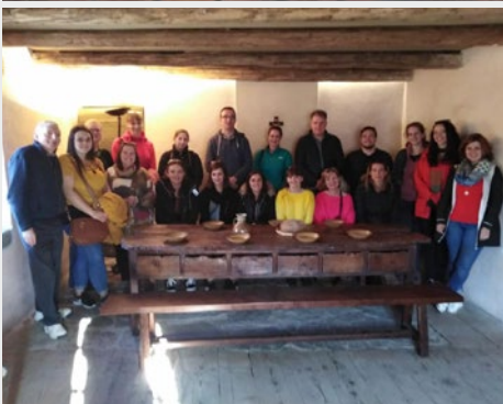
Bélgica: Província da Europa Centro Oeste em peregrinação a L'Hermitage