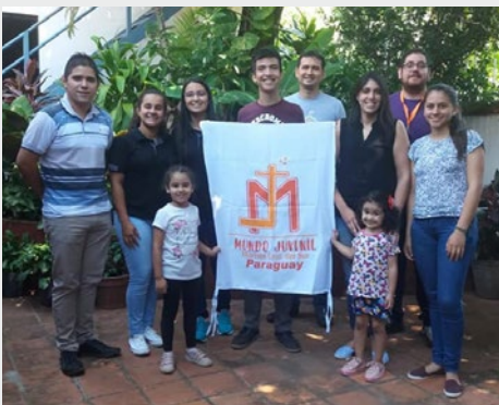
Paraguai: Encontro de responsáveis Locais - Mundo Juvenil Marista - Asunción