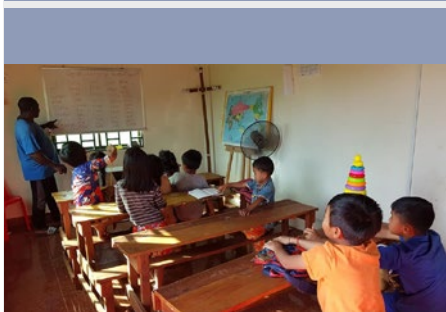
Camboja Comunidade de Pulung